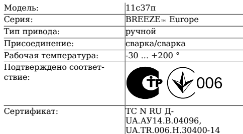
Таблица 1. Характеристики